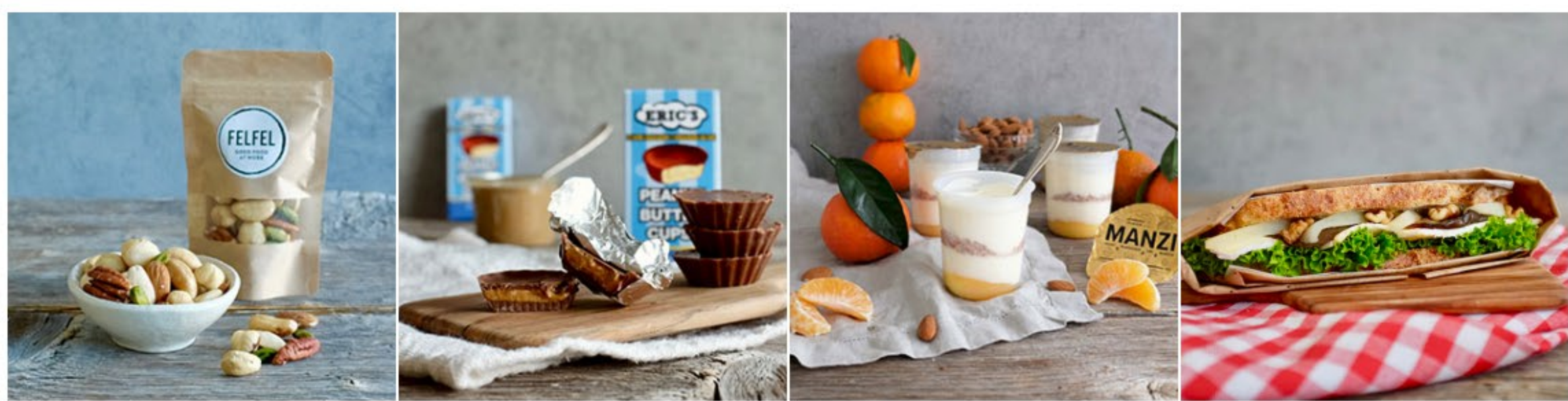
JUST NUTS Kreation: FELFEL