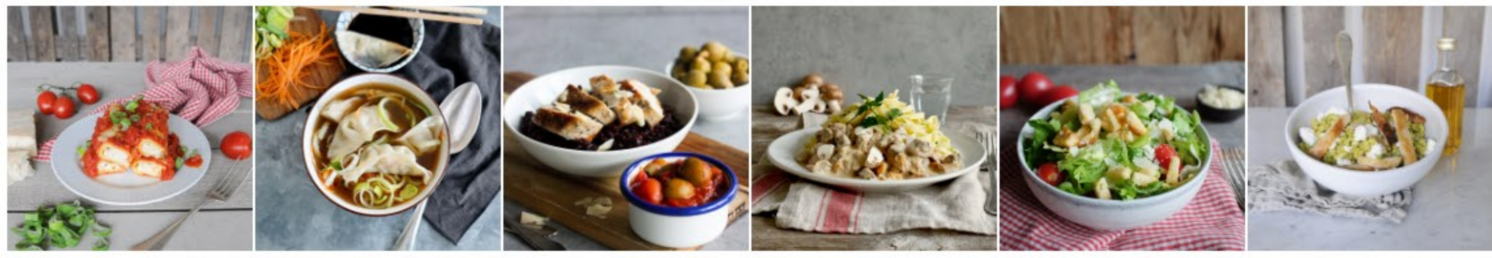
CANNELLONI AL FORMAGGIO Koch: Giovanni