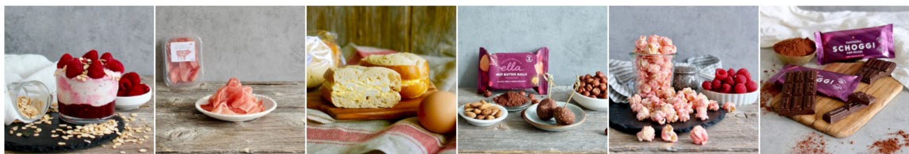
MÜESLI MIT HIMBEERCOULIS Sennerei: Saaländ