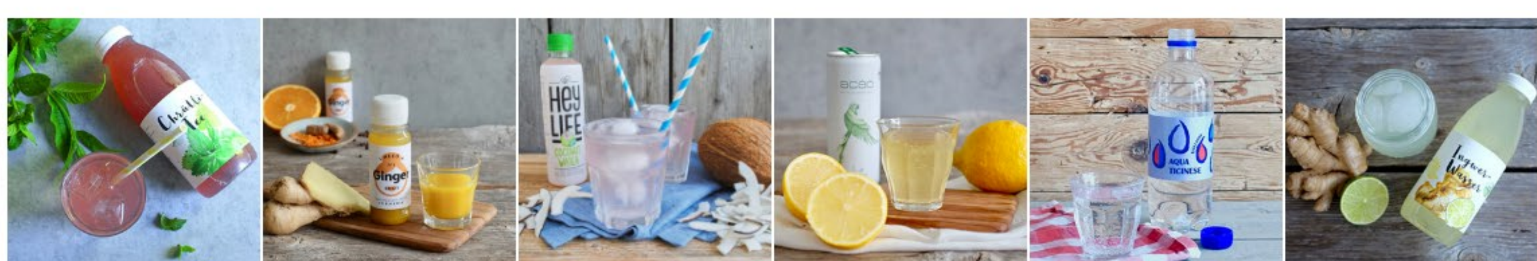
BIO CHRÜTLI TEE - MATE MINZE